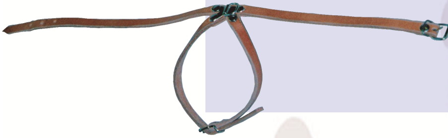
Arnés mini. Ref.: AM15

Arnés en cuero de 3 mm de grosor y de 15 mm de ancho. Fabricado en cualquier medida.