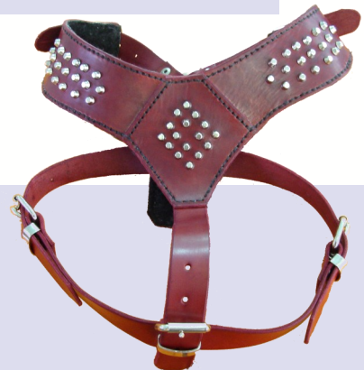
Petos Ref.: P1/P2

Arnés en cuero de 3 mm de grosor y de 30 mm de ancho. Varios colores y cualquier medida