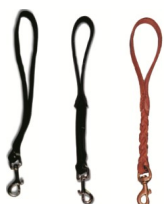
Puños de cuero Ref-PK

Puños realizados en cuero con diferentes anchuras ( 15 o 20 mm ) y también acabados lisos, trenzados o nylon forrado en cuero.