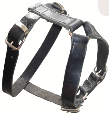
Arnés mediano Ref.: P3C

Arnés en cuero de 3 mm de grosor y de 30 mm de ancho. Varios colores y cualquier medida