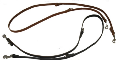
Correas de cuero para adiestramiento. Ref.: KA

Correas de adiestramiento en cuero de 4 mm de grosor y 2 cm de ancho y 2 metros de largo. Se pueden realizar en cualquier medida y distintos colores.