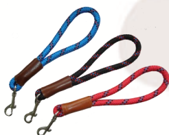
Puño de nylon. Ref.:PN

Puño de nylon de 14 mm de grosor. Se realizan en colores azul, rojo y negro.