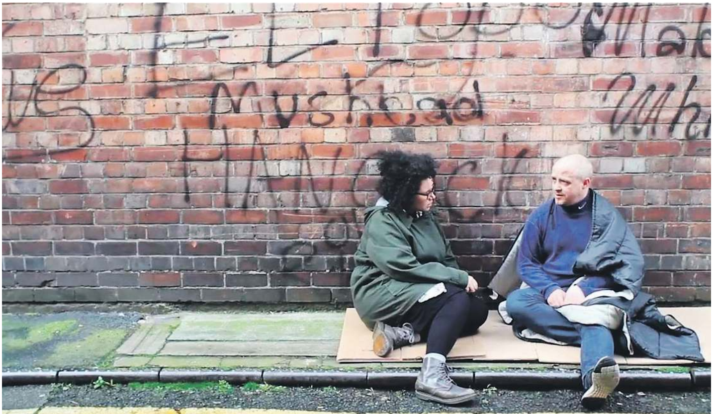
Bizitegi antzeman du «asko» egin duela gora Bilbon kalean bizi diren kopuruak. BIZITEGI

Espereintzia burutu duten ikastetxeetako ikasleen eta ira-